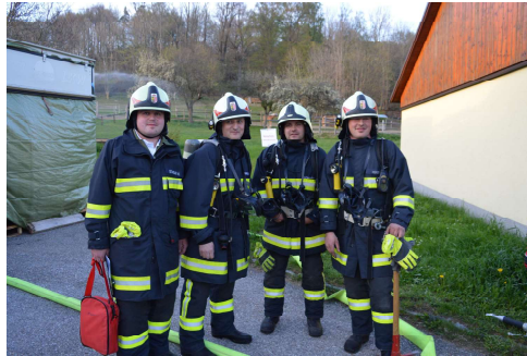
Atemschutztrupp bei Florianiübung

Mit den Fahrzeugen legten wir im vergangenen Arbeitsjahr eine Strecke von 3595 km zurück.