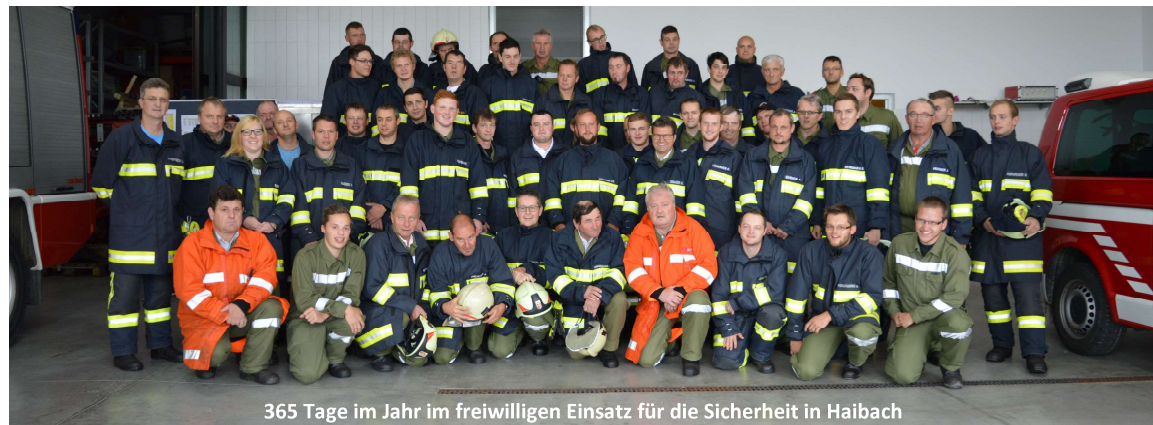
365 Tage im Jahr im freiwilligen Einsatz für die Sicherheit in Haibach

Gutes Miteinander, der Zusammenhalt und die Beherrschung der fachlichen Komponenten sind die Grundlage für eine funktionierende Feuerwehr, für eine funktionierende Hilfs-Gemeinschaft. Dass bei uns in Haibach diese Voraussetzungen vorhanden sind und erfüllt werden, konnte bei der Ablegung der „ Bezirksleistungsplakette “ eindrucksvoll bewiesen werden. 82 Prozent der aktiven Mitglieder (66 Feuerwehrleute) erfüllten die Voraussetzungen für die Ablegung dieser Leistungsprüfung mit Bravour.