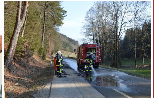
Gülleinsatz - Bundesstraße Gusental