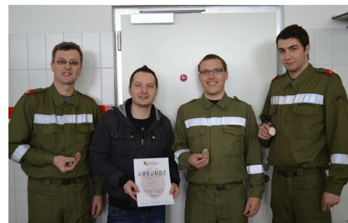
Atemschutzleistungsabzeichen Stufe 1—Bronze

Der gemütliche Ausklang führte uns in den Weinbau- und Heurigenbetrieb der Familie Winter in Unterretzbach . Der Betrieb liegt im nordwestlichen Weinviertel, in der Region Retzer Land. Geführt wird der Weinbau- und Heurigenbetrieb in der zweiten Generation unter Mitarbeit des zukünftigen Nachfolgers. So wie im Weinbau der Wein im Mittelpunkt steht, der durch gepflegte Weingärten und schonende Verarbeitung im Keller seine Vielschichtigkeit entfalten kann, spielt beim Heurigen der Gast, dem hausgemachte Schmanckerln geboten werden, die Hauptrolle. Das konnten wir auch bei unserem Besuch erleben.