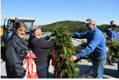
Maibaumaufstellen und Pfingst-Frühschoppen