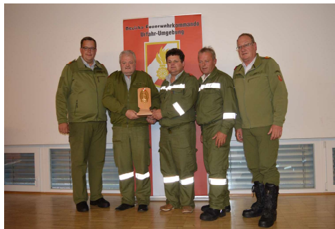
Überreichung der Plakette in Gold