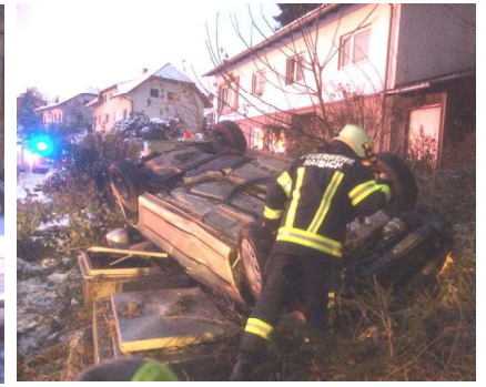
2x Autounfall auf der Altenbergerstraße im November