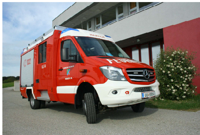
neues KLF-A seit 2018 im Dienst