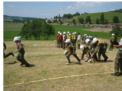
Start beim Bewerb