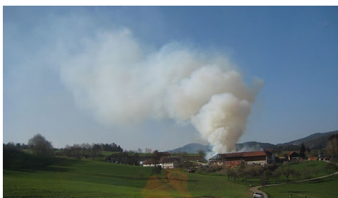
Anfahrt zum Brandobjekt in Matzelsdorf

3 Kommandositzungen wurden im Jahr 2010 abgehalten.