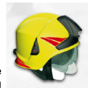
Neu angeschaffte Feuerwehrausrüstung