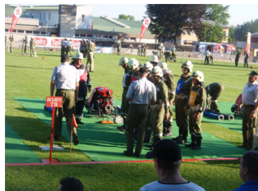
Start beim Landesbewerb