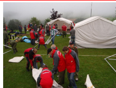
Jugendlager 2010 Unser Team beim Zeltaufbau