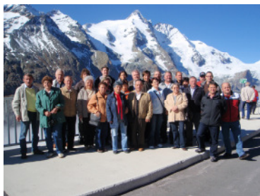
Ausflug nach Südtirol

Herzlichen Dank der Familie Rechberger für die Ermöglichung dieser Großübung und die freundliche Aufnahme der Feuerwehren.