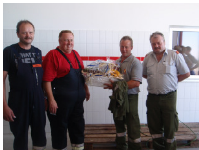
Die deutschen Freunde erreichten ebenfalls die Leistungsabzeichen