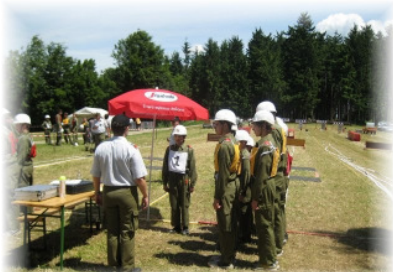
Bewerbsstart in Kirchschlag