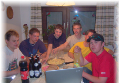
Der verdiente Abschluss eines anstrengenden Bewertungstages Eine „leckere Eierspeis“