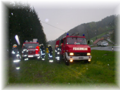
Die diesjährige Florianiübung in Rohrbach (Ottenschlag)