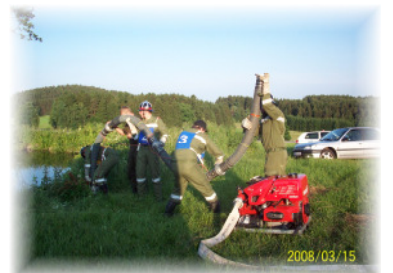
Übungen beim Rosenauerteich