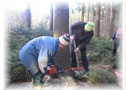
Die Feuerwehrmänner beim Fällen des Haibacher Maibaums