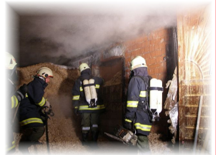
Brand der Hackschnitzelheizung beim Bauernhof „Penkner“

Die vielen freiwillig geleisteten Arbeitsstunden zum Wohle unserer Feuerwehr können wir nicht vergelten, hoffen aber dass das Zusammenarbeiten im Kommando, in guter Kameradschaft, Spaß gemacht hat – nicht nur Pflicht war.