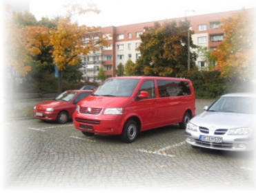
Unser neues KDO Ein VW T5 4-motion (130PS)