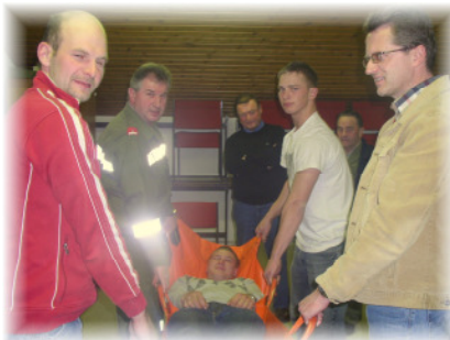
Erste Hilfe Kurs im Feuerwehrhaus

Neben den feuerwehrinternen Übungen, haben viele Kameraden unserer Wehr interessante Kurse & Ausbildungen in der Landesfeuerwehrschule absolviert.